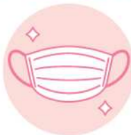
マスク着用にご協力ください