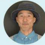
NPO 法人 山村エンタープライズ 事務局長 / 副代表理事

大阪府門真市に生まれ、奈良県奈良市で育つ。大学から岡山に移住し、岡山29年目。2013年に株式会社なんば建築工房5代目代表取締役社長就任。建築・不動産・資金計画と幅広く対応。古民家の魅力発信や建築士・宅建士として住宅選びや空き家改修に関する相談も手掛け、地元のおこし団体の設立や行政の空き家セミナーにも尽力。古民家だけでなく総合的な知識と経験を活かした活動を行っている。