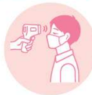
来場前及び受付での 検温にご協力ください