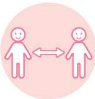
間隔をあけて お並びください