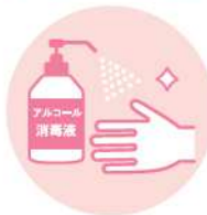
手指消毒にご協力ください