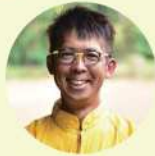
(株)アーチファーム 代表取締役 黄ニラ大使 / 岡バク大使

1998年大阪大学文学部卒。(株)ベネッセコーポレーション、オリックスアルファ(株)(現オリックス(株))にて、大学・高校向け営業、金融営業、商業施設開発、社員教育研修、プロモーション戦略立案、事業戦略立案等を歴任。2007年中小企業診断士資格取得。現在、中小企業診断士として、中小企業の経営革新、経営改善、ブランディング、人材・組織開発等の支援に携わるほか、各種経営セミナー、創業スクール等の講師を務める。