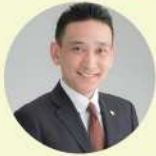
(株)エンウィーブ経営コンサルティング 代表取締役 中小企業診断士